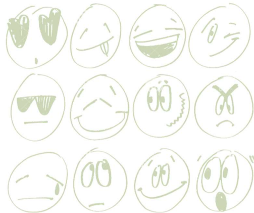
Hand Drawn Emotions SAS 70

Mijn zoon van 15 jaar gedraagt zich niet altijd volgens zijn leeftijd, hij is precies nog een klein kind.